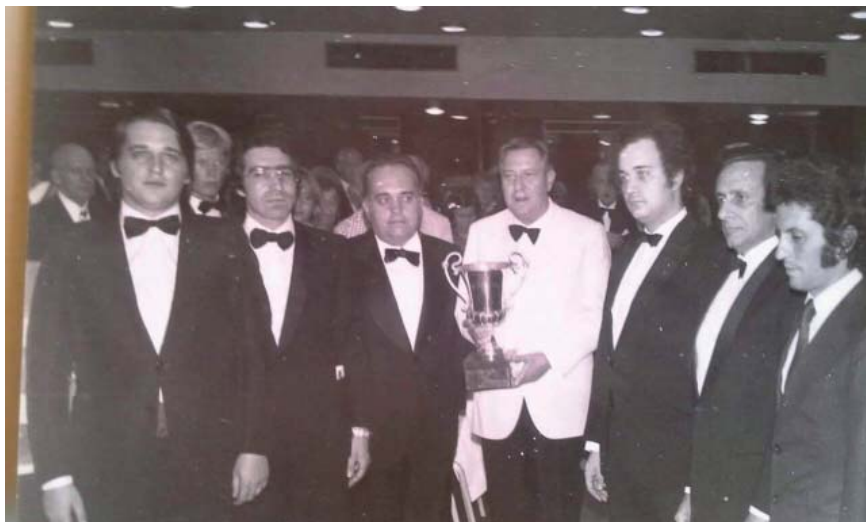
La vittoria a Brighton nel 1975

Anche nei Campionati italiani, sia a squadre Open che Miste, i suoi successi sono stati sistematici: ha conquistato dieci medaglie nazionali, fra cui ben sei ori.