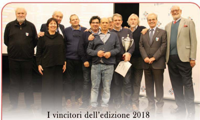
I vincitori dell'edizione 2018