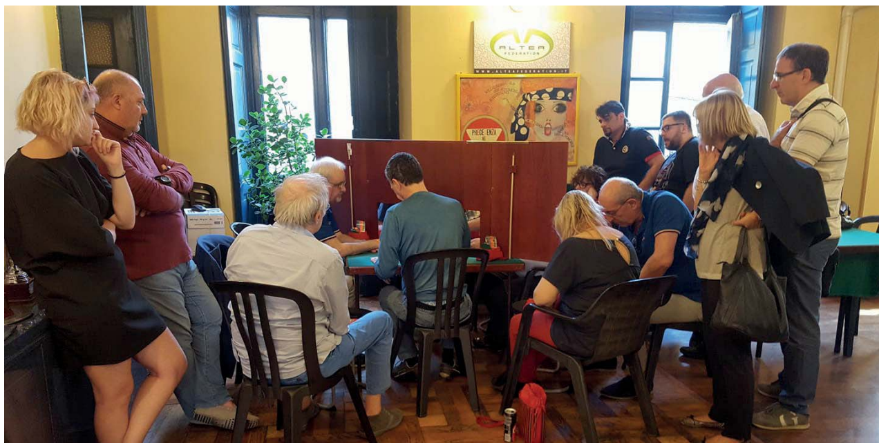
Uno scatto dell'incontro amichevole Italia-Portogallo. In questa foto Nazionale italiana Senior e Open stanno incrociando le carte durante il triangolare