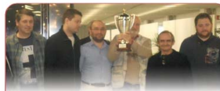
I vincitori dell'ultima edizione organizzata (2014)