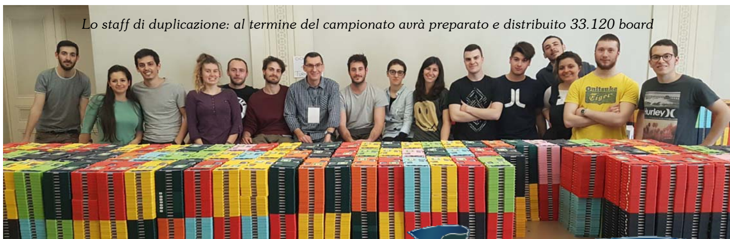
Lo staff di duplicazione: al termine del campionato avrà preparato e distribuito 33.120 board

Alla faccia del lunedì, il Palazzo dei Congressi è immerso in un'atmosfera da sabato di Campionato.