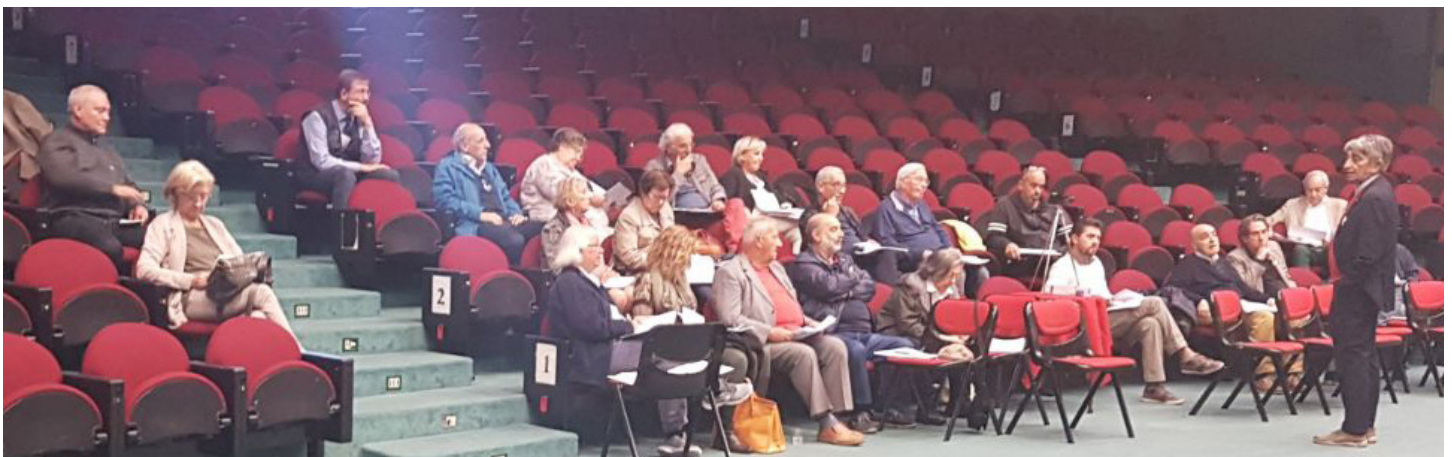
L'ultimo seminario si è svolto ieri nella Sala Guido Ferraro del Palazzo dei Congressi

Vediamo ora, uno per uno, gli articoli soggetti a modifica di maggior interesse per i giocatori.