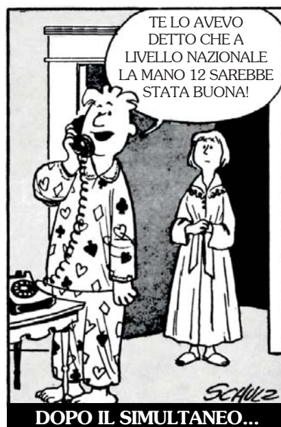
DOPO IL SIMULTANEO...