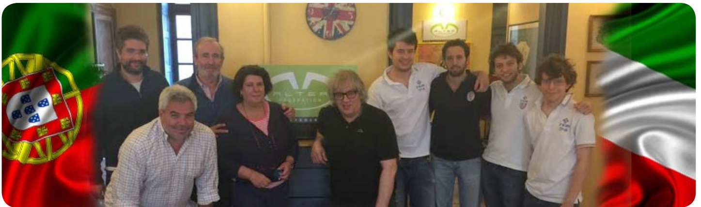
L'amichevole Portogallo-Italia si è svolta a Torino mercoledì e giovedì scorsi. Gli Azzurrini hanno avuto la meglio sui campioni portoghesi.

Penso che le regole del gioco abbiano fatto sì che noi potessimo perdere questa finale in quel modo. Penso che potrebbe esistere un regolamento che pos-