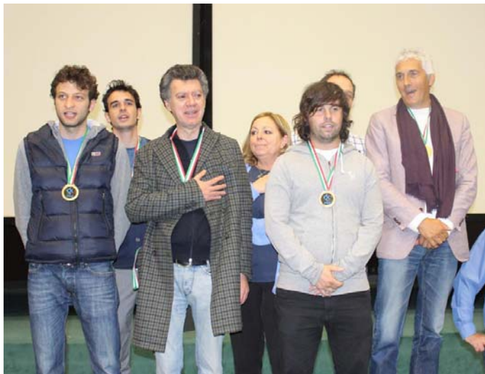
I CAMPIONI OPEN 2015 LAVAZZA - ASSOCIATO ALLEGRA

Benvenuti e ben ritrovati a Salso, fra i colori della Primavera e, soprattutto, ogni sfumatura del bridge nazionale. Qui al Palazzo dei Congressi ognuno ha il suo titolo da conquistare. Di massimo prestigio, però, è ovviamente il titolo Nazionale, che, come sappiamo, ruota intorno ai gironi di Eccellenza delle due serie open e femminile.