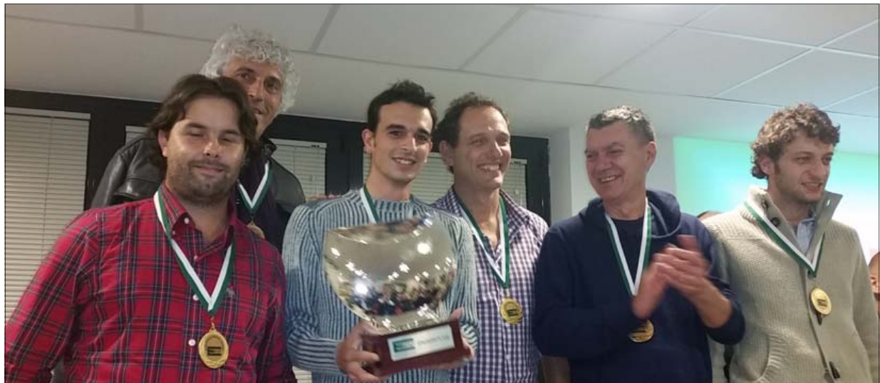
La Squadra Allegra, durante la premiazione della European Champions' Cup