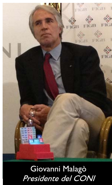
Giovanni Malagò Presidente del CONI