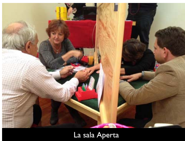
La sala Aperta