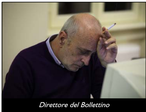
Direttore del Bollettino