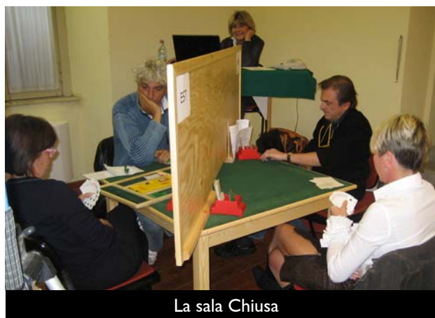
La sala Chiusa