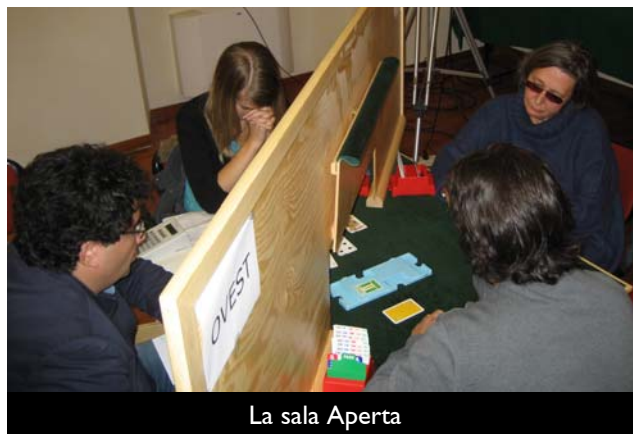
La sala Aperta