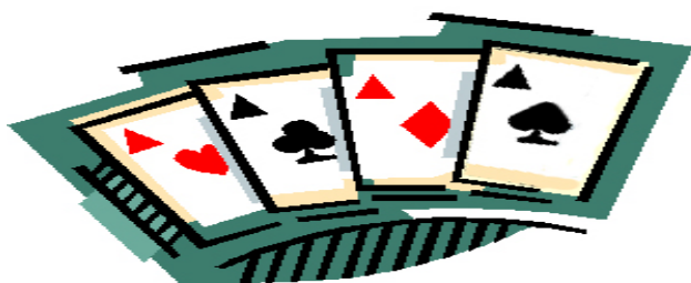
Board 10 - dich. Est - tutti in zona

In EO va a Cambon - Censi che chiamano 4 cuori e riescono a mantenere l'impegno.