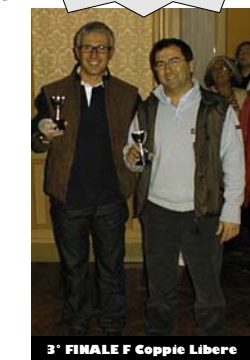
3° FINALE F Coppie Libere