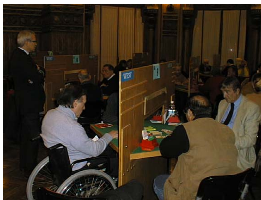
Momenti di Campionato: al tavolo prima, ai commenti poi