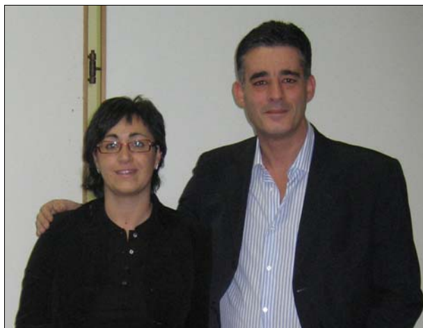
I vincitori del 3° ANNO