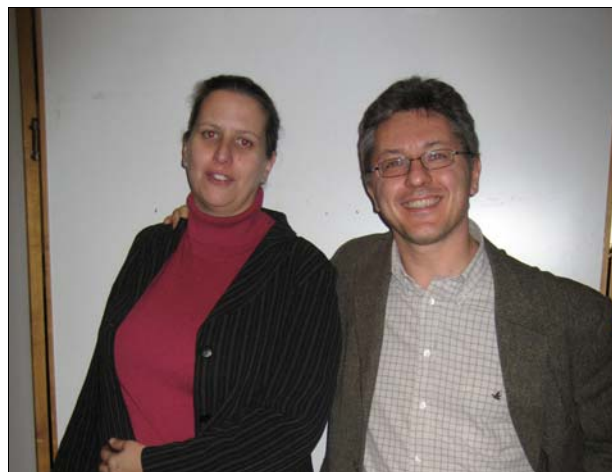
I vincitori del I° ANNO