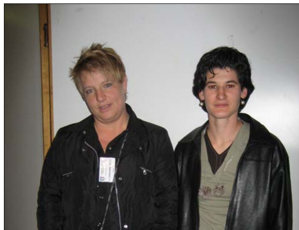
I "vincitori" del 2° ANNO