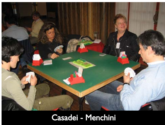
Casadei - Menchini

Qui 3SA dovrebbe giocarli Nord, Est avrebbe già enormi problemi in attacco, e ad ogni modo è mooolto difficile imbastire una difesa che non finisca per regalare la nona presa, dando ragione a chi ha scommesso sulla manche più popolare.