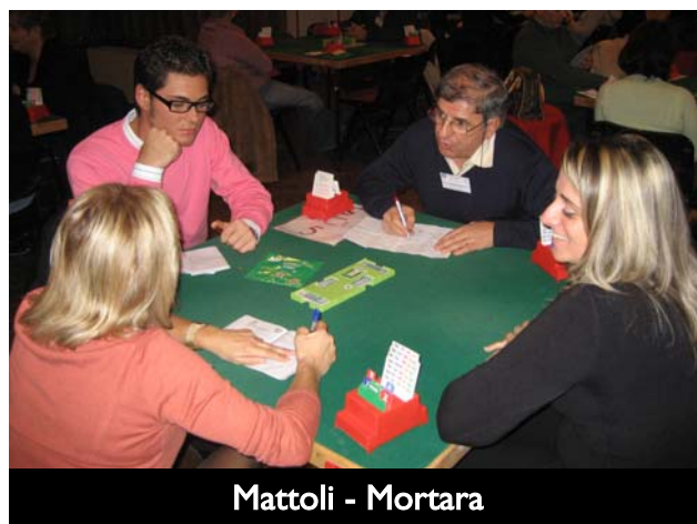
Mattoli - Mortara

Alla 24 sia Nord che Est hanno l'apertura di ISA, e il secondo a tutti i tavoli ha disciplinatamente lasciato campo libero al primo, ancor più volentieri dopo il parziale a picche selezionato da Sud.