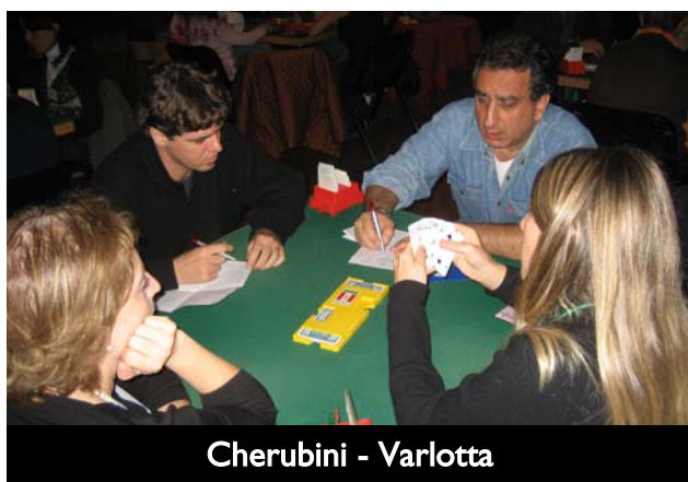
Cherubini - Varlotta

Alla 24 sia Nord che Est hanno l'apertura di ISA, e il secondo a tutti i tavoli ha disciplinatamente lasciato campo libero al primo, ancor più volentieri dopo il parziale a picche selezionato da Sud.