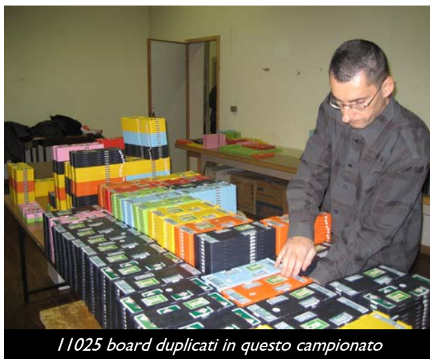
11025 board duplicati in questo campionato

Per la stragrande maggioranza di noi questo è stato l'ultimo appuntamento della stagione o, almeno, l'ultima adunata di massa . Solo alcuni eletti, infatti, si ritroveranno tra un mese a Bologna per le Finali di Coppa Italia. E quindi...è d'uopo salutarci ed augurare a tutti voi un felice autunno – inverno prima di ritrovarci tutti qui a primavera per, guarda caso, i... Primaverili 2007.