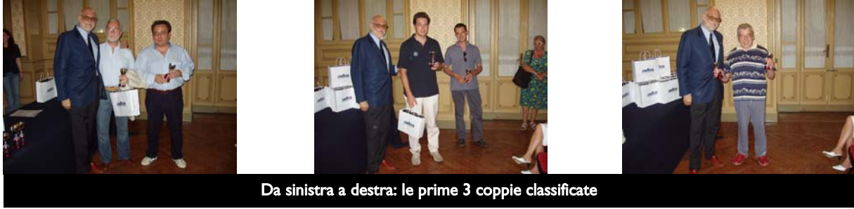
Da sinistra a destra: le prime 3 coppie classificate