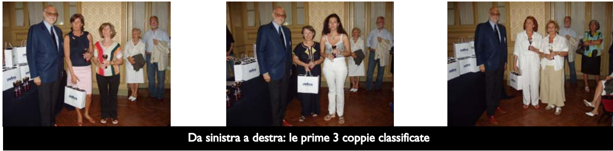
Da sinistra a destra: le prime 3 coppie classificate