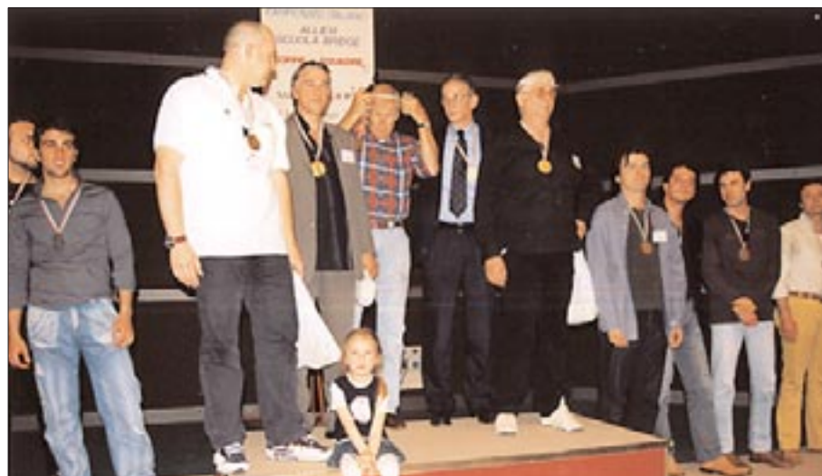
Il podio delle Squadre del 1° anno.