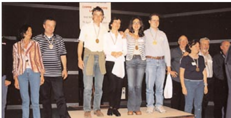
I vincitori delle Squadre del 2° anno.