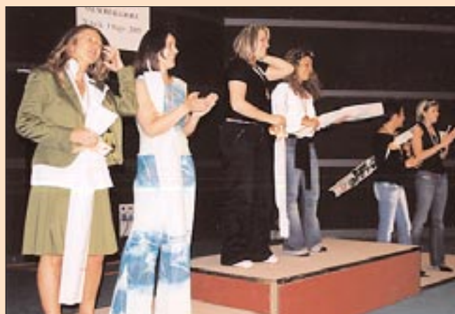
I podi del 1° anno: il coppie Open (a fianco) e il coppie Signore (sopra).