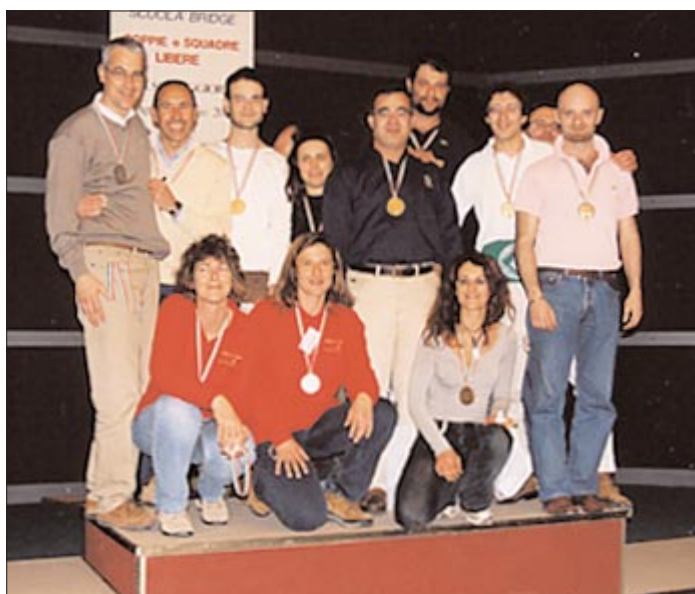
Il podio delle Squadre del 3° anno.