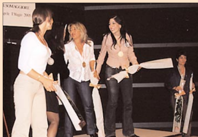
I podi del 2° anno: il coppie Open (a fianco) e il coppie Signore (sopra).

quel momento, per farci riappacificare con il mondo.