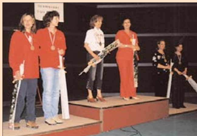
I podi del 3° anno: il coppie Open (a fianco) e il coppie Signore (sopra).