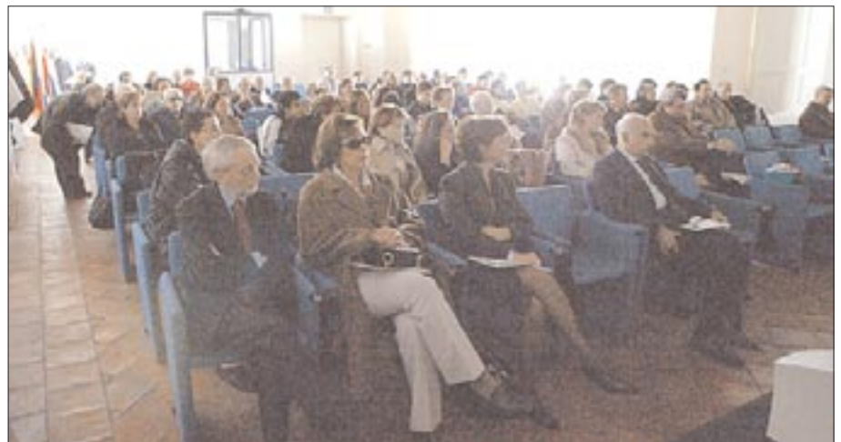
La platea degli intervenuti al convegno, ospitato nelle sale del Belvedere di San Leucio.