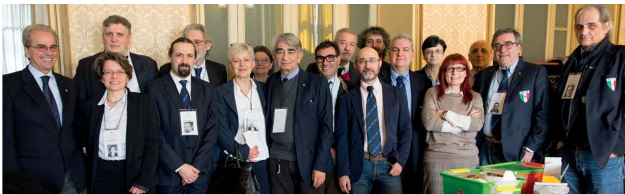
Parte dello staff arbitrale