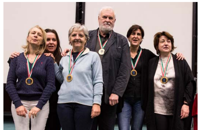
TITOLO SIGNORE 2016 FORNACIARI - BRIDGE REGGIO EMILIA