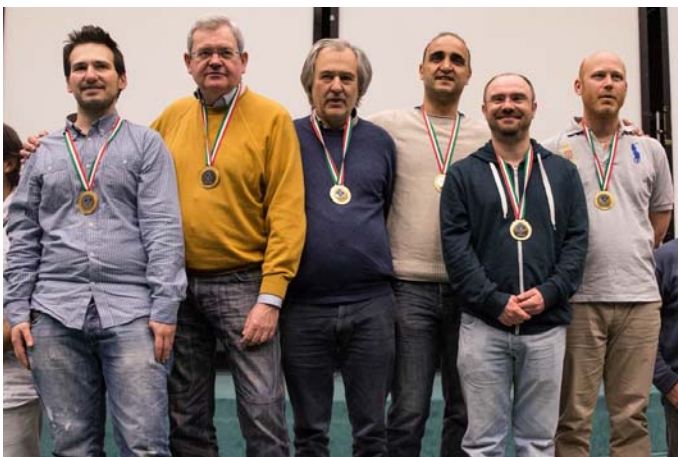
I CAMPIONI OPEN 2016 PALMA - BRIDGE VILLA FABBRICHE